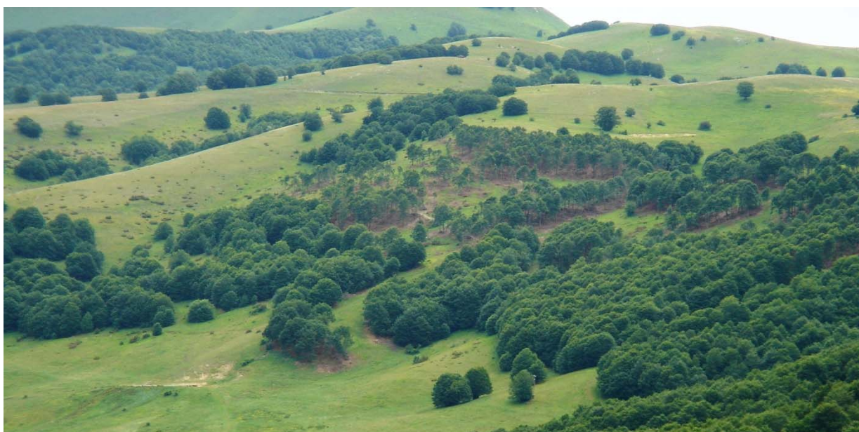
Fig. 2 – Nuclei di faggio appartenenti all'ecotono bosco-prateria.

A tutti i partecipanti si chiede la disponibilità dei veicoli fuoristrada per migliorare l'efficienza dei trasporti durante la giornata, dandone comunicazione nella mail di iscrizione.